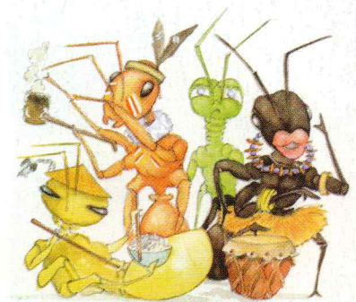
Combien y a-t-il d'espèces de fourmis ?