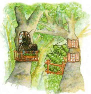
Fourmis et pucerons : de bons voisins ?