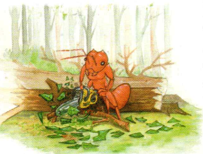
Certaines fourmis sont-elles capables de détruire une forêt ?