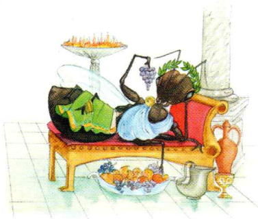
Reine chez les fourmis : un dur métier ?

– Regarde ! Elles arrêtent pas de courir. Elles ont l'air rudement pressées.