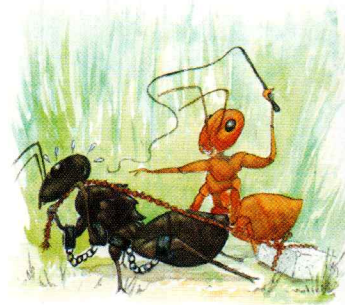
L'esclavage est-il vraiment aboli ?

– OK. Dis, au fait, les fourmis vertes, ça existe ? »