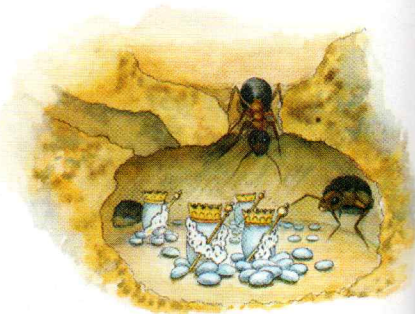
Reine ou ouvrière : qui décide ?