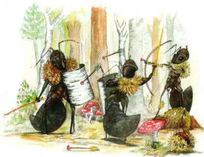
Pourquoi les fourmis se font-elles la guerre ?