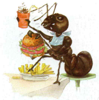
Les fourmis aiment-elles les hamburgers ?

– J'en ai pas vraiment peur, mais elles m'impressionnent quand y en a beaucoup à la fois. L'été dernier, on a eu notre balcon envahi par des fourmis volantes. Il a fallu fermer toutes les fenêtres. Heureusement, le lendemain, elles avaient disparu.