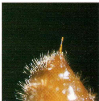
Dans la panoplie des guerrières, le dard.

Culture, élevage, vie en société... Il est tentant de rapprocher, de comparer hommes et fourmis. Comme l'homme, les fourmis sont capables du meilleur comme du pire.