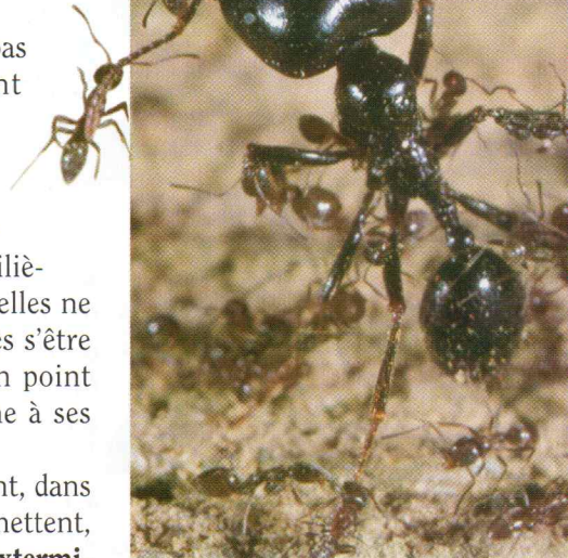
Des fourmis d'Argentine s'en prennent à un soldat granivore. Les plus petites l'emporteront.

Mais dans certains cas, elles se battent furieusement, dans un combat à mort. Quand toutes les fourmis s'y mettent, c'est une tuerie collective qui peut aller jusqu'à l' extermination totale de la fourmilière, particulièrement chez les fourmis des trottoirs ou des caniveaux dont nous avons déjà parlé.