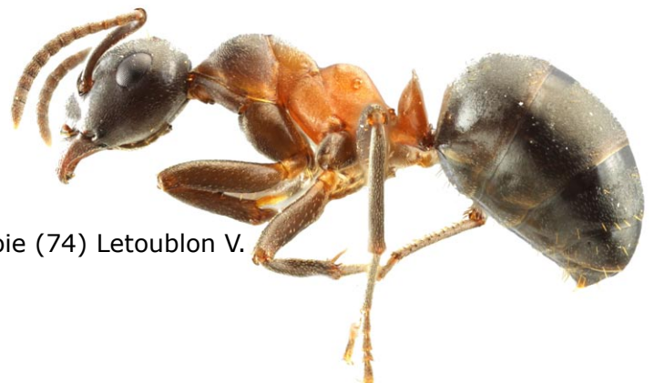
Formica uralensis

Formica uralensis - Doubs (25) Wegnez P. et al. Formica bruni - Doubs (25) Walbru et Letoublon V. Lasius rabaudi - Pyrénées-Orientales (66) Lebas C.