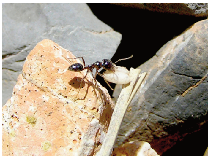
Figura 1. Obrera de R. minuchae transportando dos pupas de la hospedadora P. longiseta al hormiguero mixto parásito tras un asalto.

Los parásitos sociales suelen ser filogenéticamente próximos a sus hospedadores, lo que les conduce a tener tasas similares de mutación y migración, así como tamaños poblacionales y potencial evolutivo comparables (Pennings et al. 2011). No obstante, estudios recientes en los que se compara la genética poblacional de parásitos sociales y sus hospedadores, obtuvieron resultados contradictorios, mostrando desde la ausencia de diferencias en diversidad genética o estructuración poblacional entre hospedadores y parásitos, lo que se interpretaría como un potencial evolutivo similar en estas parejas (Hoffmann et al. 2008; Foitzik et al. 2009; Pennings